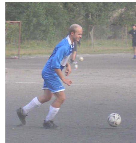
Vítkovou největší devízou je kvalitní defenzivní práce...

a informace mám jenom z doslechu, tak si myslím že s nima jsme vyhrát měli. Když budeme ztrácet body s takovými týmy, tak skončíme někde v dolní polovině.